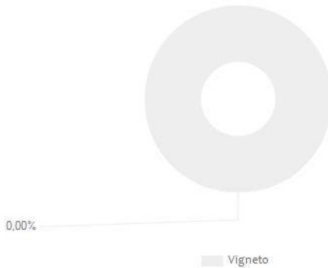
Figura 1. Valori percentuali dei diversi contributi rispetto a "Direct Water Scarcity Footprint" e "Non-Comprehensive Direct Water Degradation Footprint" TOTALI, per una bottiglia di 7 note.