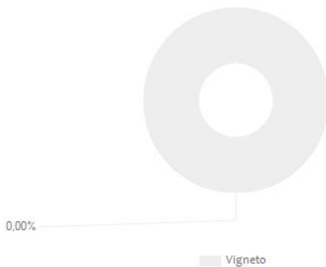
Figura 1. Valori percentuali dei diversi contributi rispetto a “Direct Water Scarcity Footprint” e “Non-Comprehensive Direct Water Degradation Footprint” TOTALI, per una bottiglia di RIVO ROSÈ RIFERMENTATO .