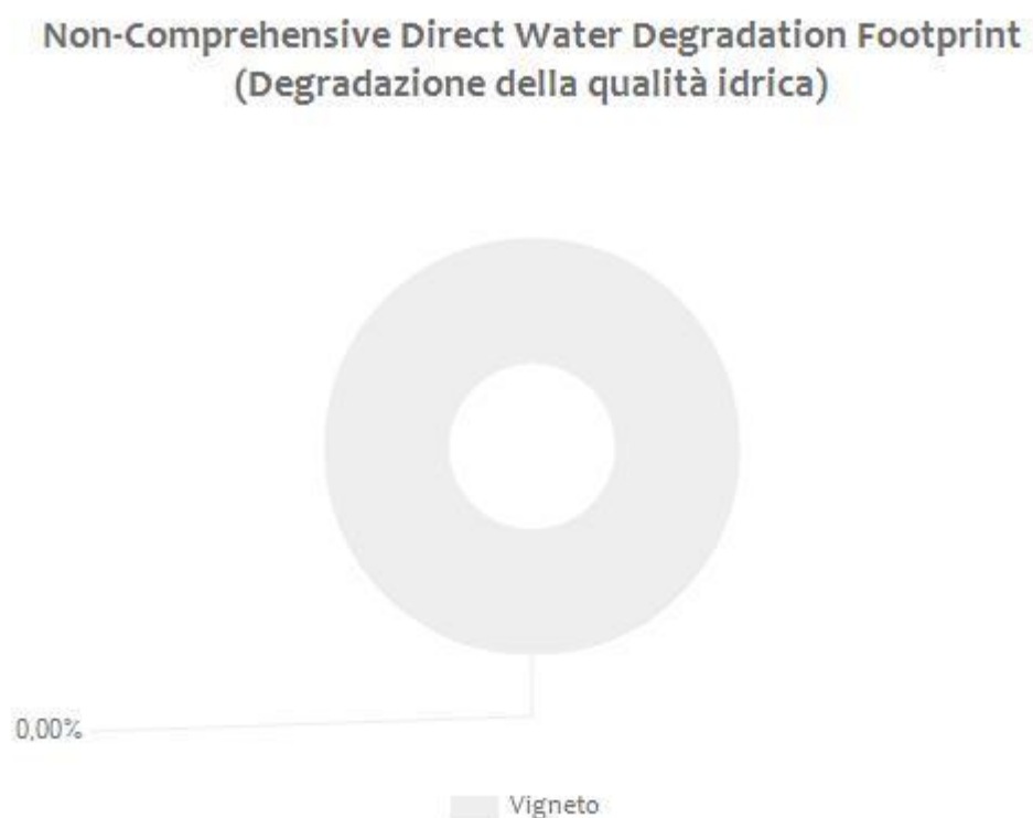
Figura 1 Valori percentuali dei diversi contributi rispetto a “Direct Water Scarcity Footprint” e “Non-Comprehensive Direct Water Degradation Footprint TOTAL” per l’azienda Querciabella Società Agricola Spa .