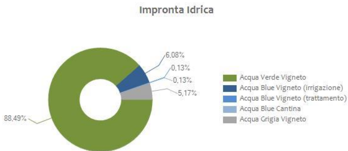
Figura 1 Valori percentuali dell'impronta idrica verde, blu e grigia.