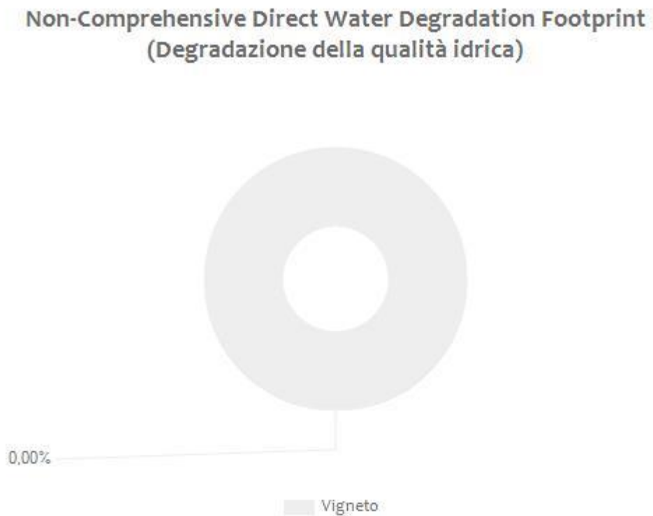
Figura 1 Valori percentuali dei diversi contributi rispetto a “Direct Water Scarcity Footprint” e “Non-Comprehensive Direct Water Degradation Footprint TOTALI” per l’azienda Soc. Agricola Tenute Rapitalà S.p.A..