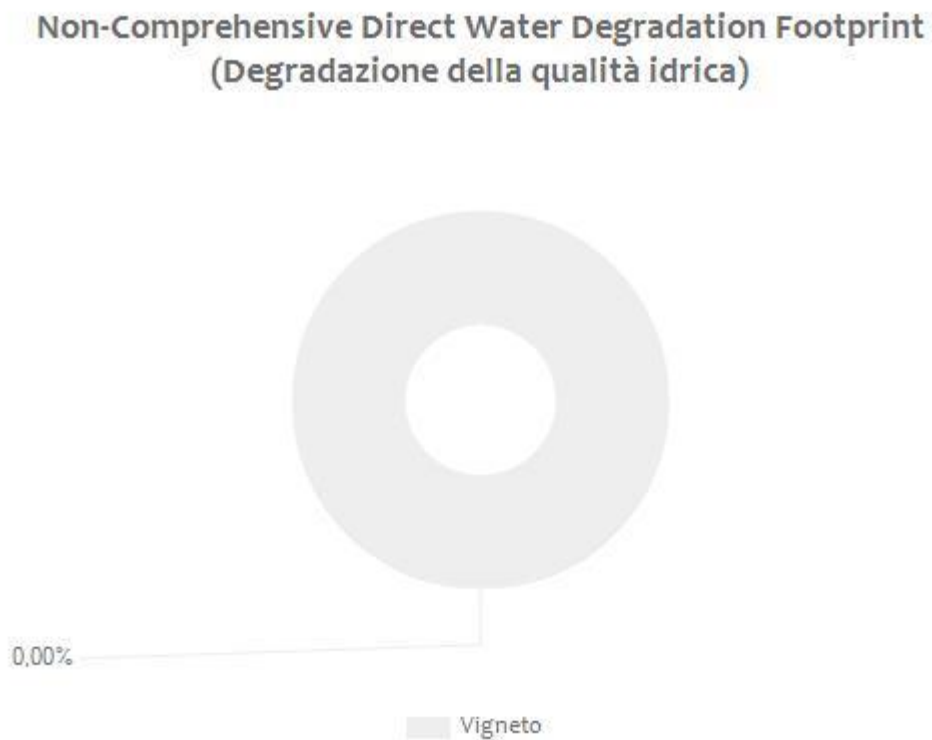
Figura 1 Valori percentuali dei diversi contributi rispetto a “Direct Water Scarcity Footprint” e “Non-Comprehensive Direct Water Degradation Footprint TOTAL” per l’azienda Cantina Marilina di Paternò Marilina .