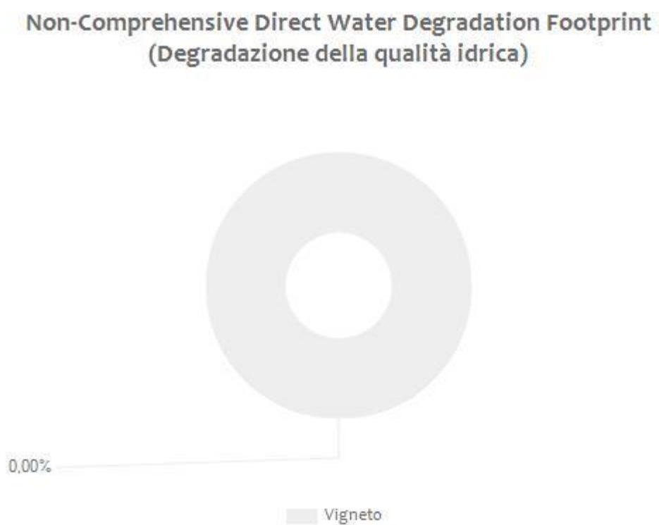
Figura 1 Valori percentuali dei diversi contributi rispetto a “Direct Water Scarcity Footprint” e “Non-Comprehensive Direct Water Degradation Footprint TOTALI” per l’azienda Valle dell’Acate Coop. Agr.